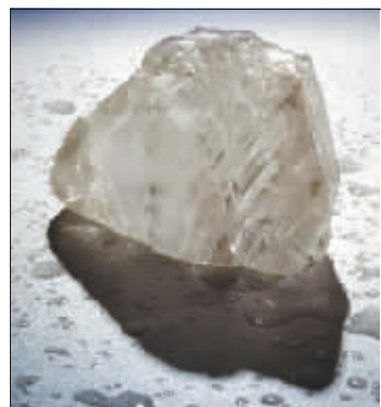
大钻石犹如橙子一般大。