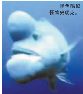
怪鱼酷似怪物史莱克。