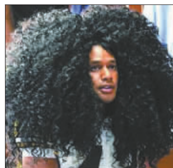
特洛伊的“爆炸头”受到了宝洁公司的青睐,即将代言海飞丝。